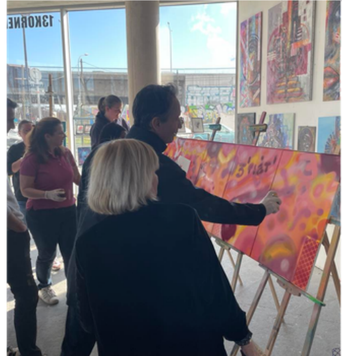
Photo de groupe. Présentation de l'œuvre. Cocktail optionnel.